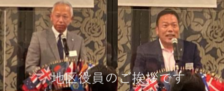
地区役員のご挨拶です