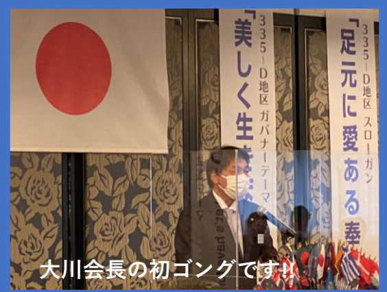
大川会長の初ゴングです!