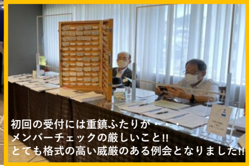
初回の受付には重鎮ふたりが メンバーチェックの厳しいこと!! とても格式の高い威厳のある例会となりました!!