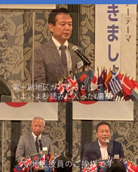
第一副地区ガバナーとして いよいよ秒読みに入ったL廣田