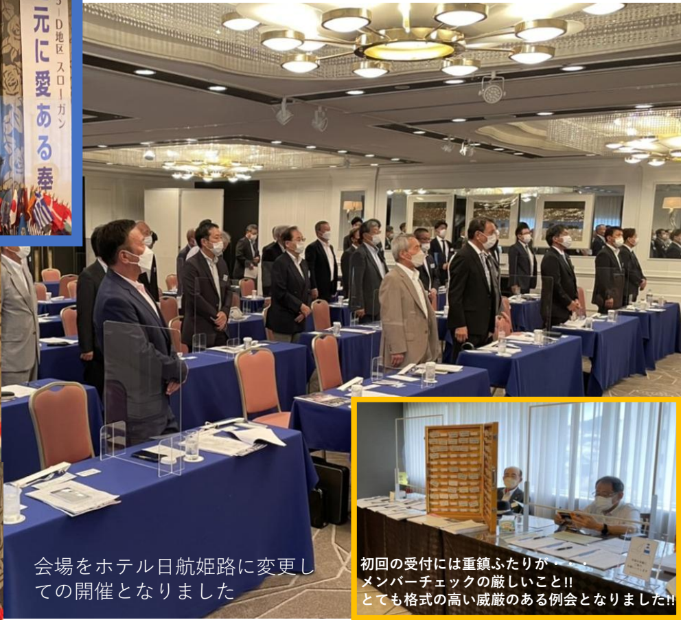
会場をホテル日航姫路に変更し での開催となりました