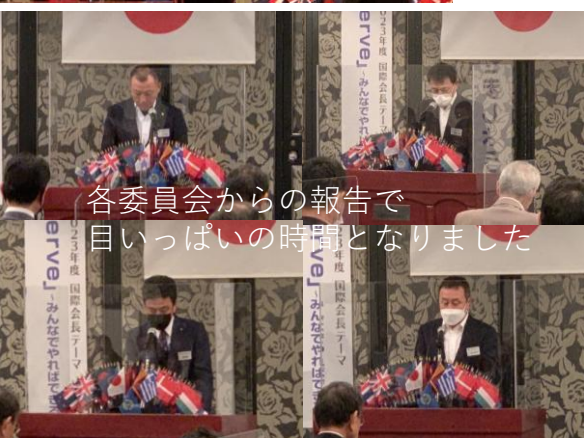
各委員会からの報告で 目いっぱい時間となりました