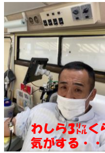
わしう3杯くらい抜かれたような 気がする・・・肉喰っどこ・・・