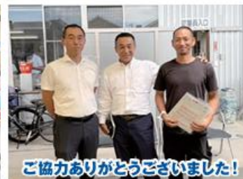
ご協力ありがとうございました!