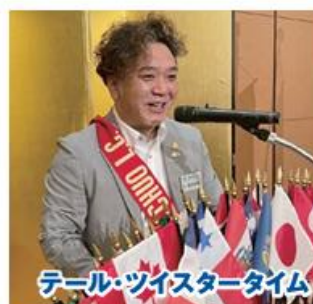
テール・ツイスタータイム