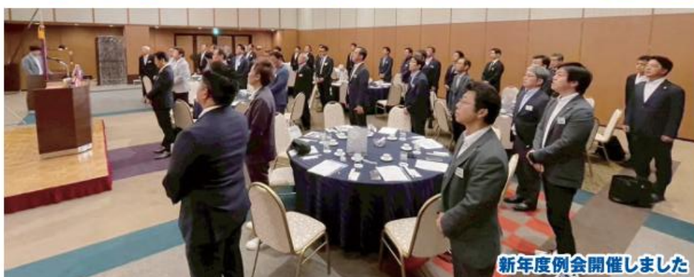
新年度例会開催しました