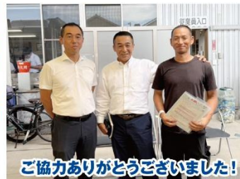
ご協力ありがとうございました!