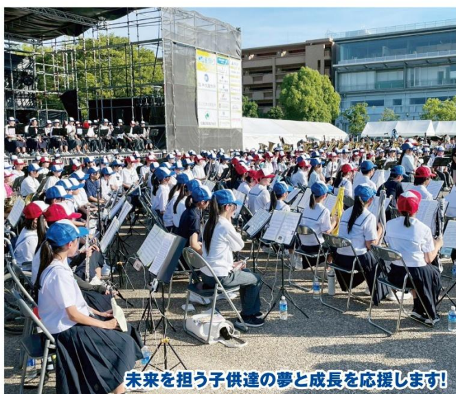
未来を担う子供達の夢と成長を応援します!