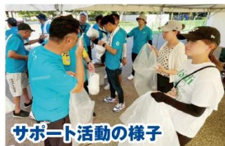
サポート活動の様子