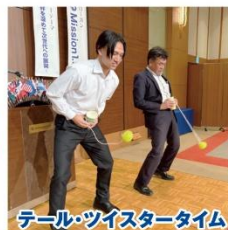
テール・ツイスタータイム