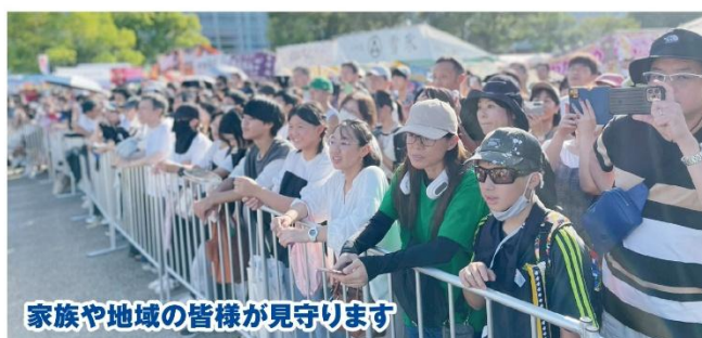
家族や地域の皆様が見守ります