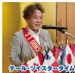
テール・ツイスタータイム