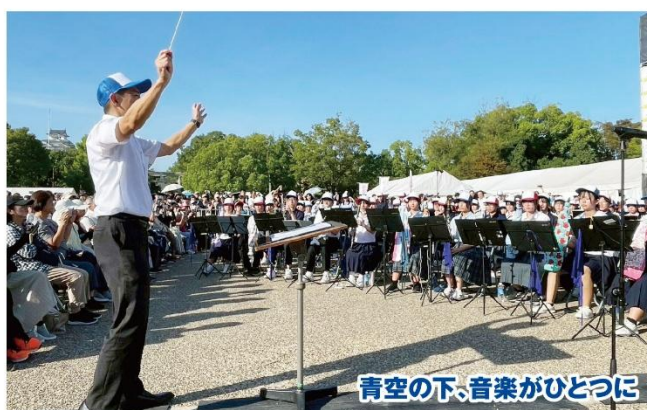
青空の下、音楽がひとつに