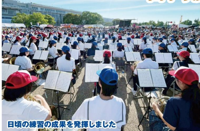
日頃の練習の成果を発揮しました