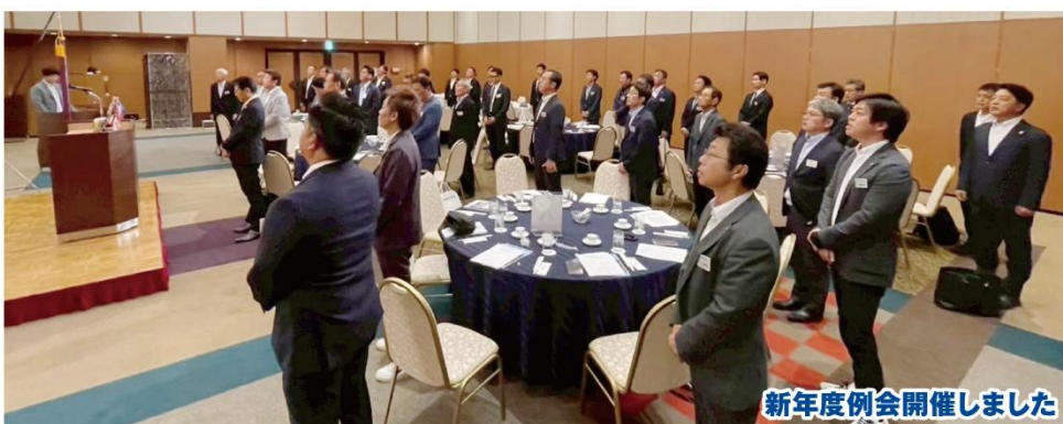
新年度例会開催しました